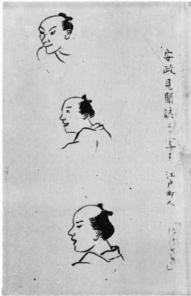
江戸の町人(はけさき)一安政見聞誌より