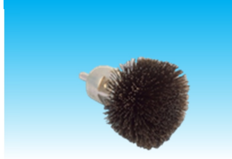
名称：傘型ワグブラシ 45-6-25-0.3 価格：800 円 コード：31450100