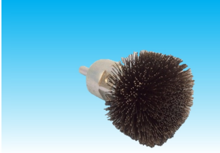
名称：軸付傘型ワグブラシ 35-6 0.3 価格：600 円 コード：C6-004