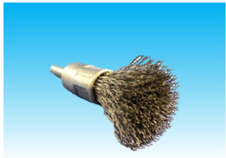
名称：軸付筒型BRHブラシ 15-6 0.3 価格：200 円 コード：C5-005