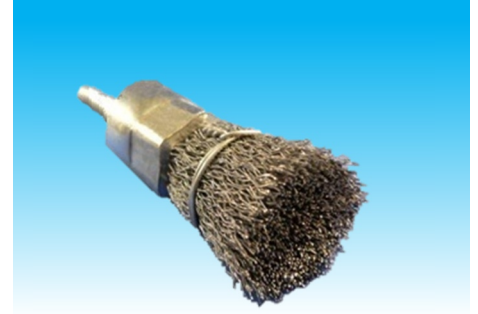
名称：軸付ワグブラシ筒型 25 価格：400 円 コード：31110002